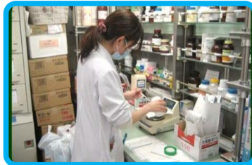
調剤業務・院内製剤