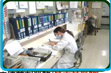
病棟薬剤業務(処方前業務) (医師等からの相談応需) (処方箋作成への関与など)