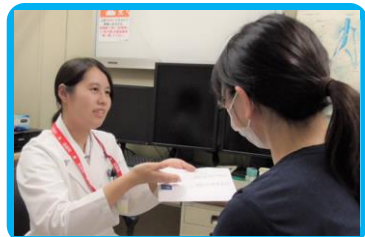
薬剤管理指導(処方後業務) (患者面談・服薬指導・記録)