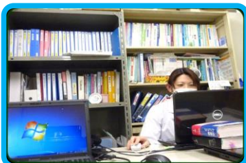
医薬品情報 (DI) 薬物血中濃度モニタリング (TDM)