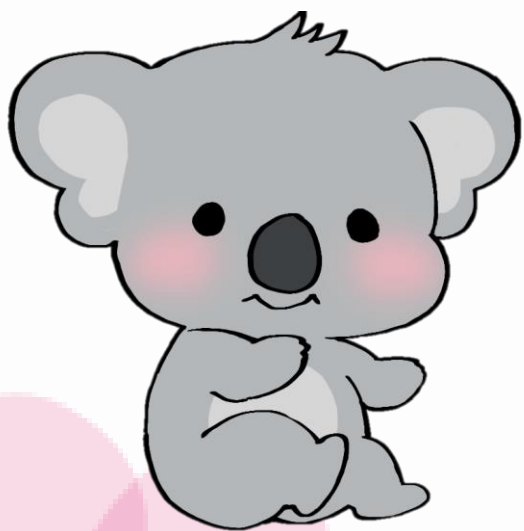
金沢文庫病院イメージキャラクター ぶんこあら