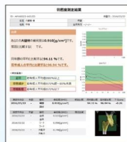
測定結果レポート画面